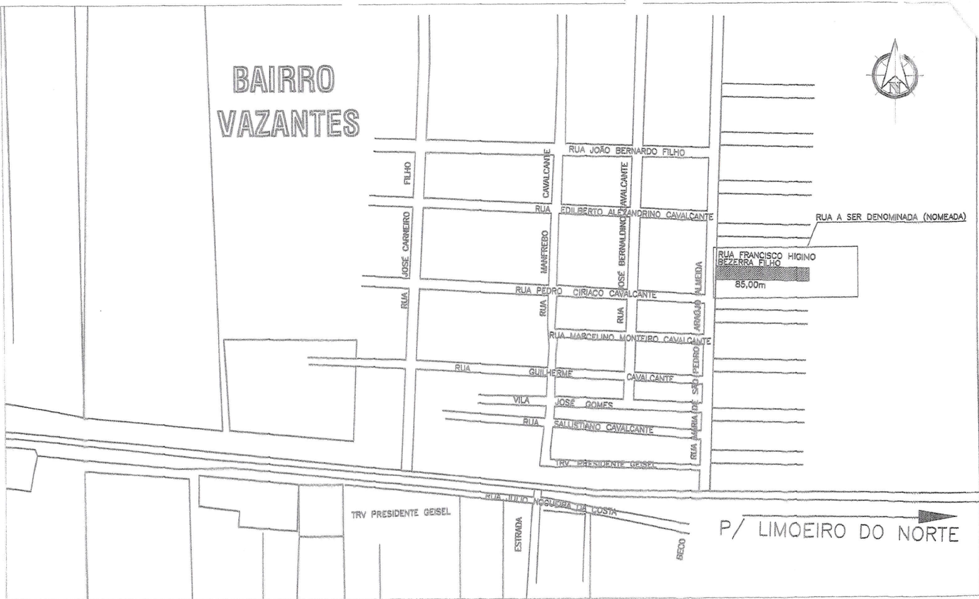
MAPA DE RUA A SER DENOMINADA NO BAIRRO VAZANTES DEZ/2014